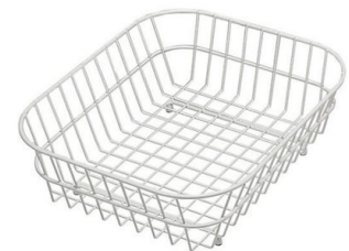
Weißer Korb 8612 100