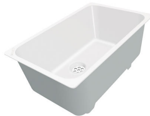
Weiße Wanne 8153 100